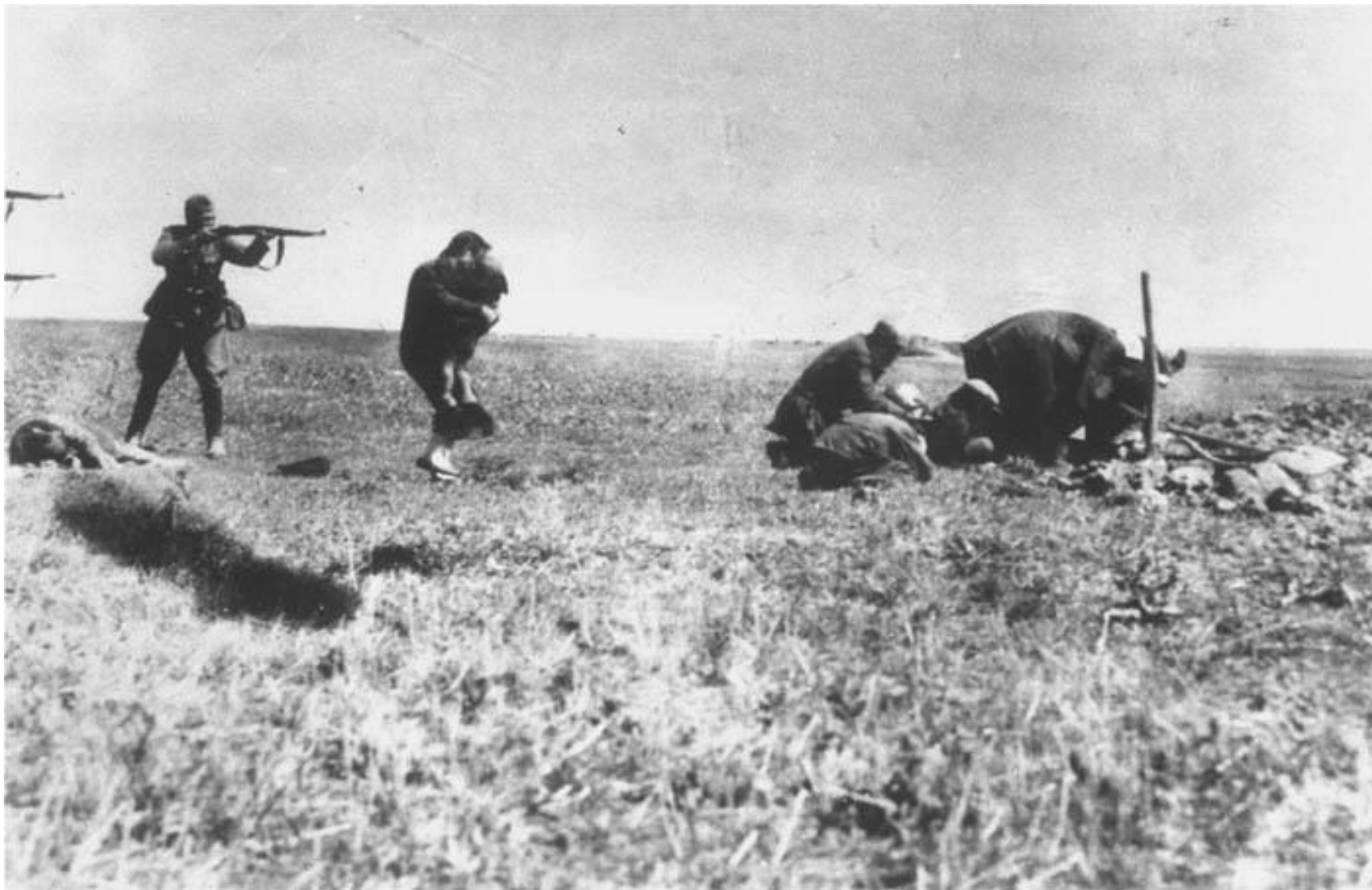
Ivangorod, Ukraina, 1942